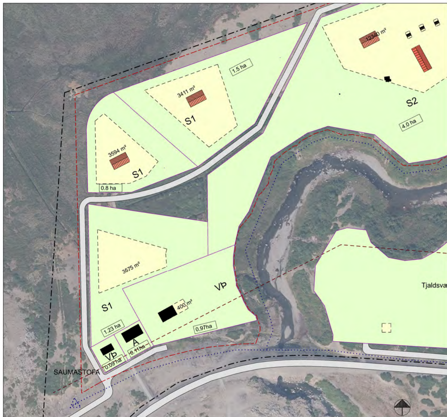
Breytt deiliskipulag, maí 2023