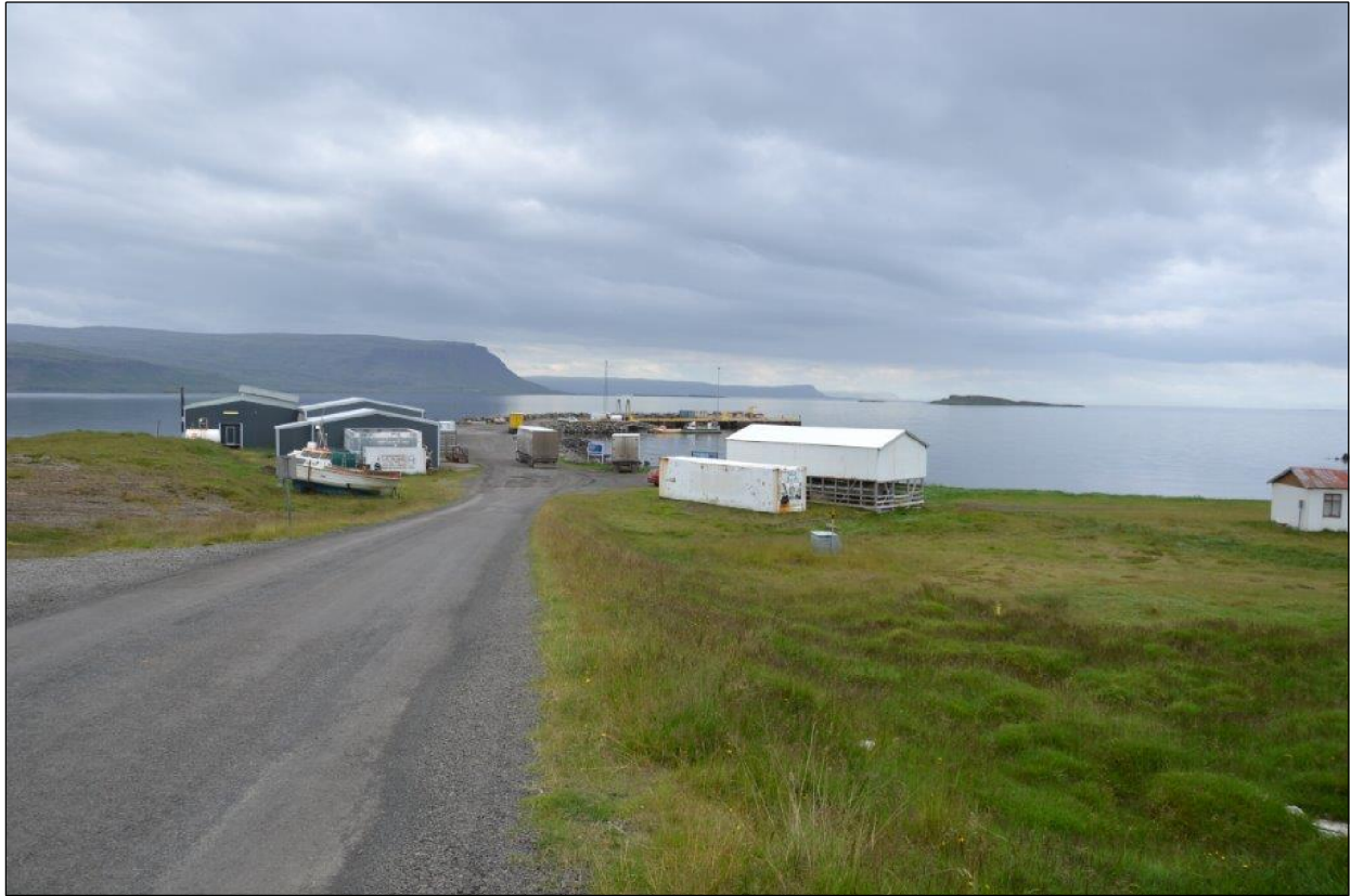
Brjánslækjarhöfn séð frá vestri.

Innan deiliskipulagsvæðisins eru samkvæmt Þjóðskrá Íslands, skráðar tvær lóðir sem eru: Brjánslækur Innri-Grundartangi L139783, sem er 4.788 fm að stærð. Á henni er skráð iðnaðarhús sem er 893,4 fm, byggt 1979. Brjánslækur Flókagrund sem er 1.500 fm að stærð. Á henni er skráð einbýlishús sem er 39,3 fm, byggt 1980