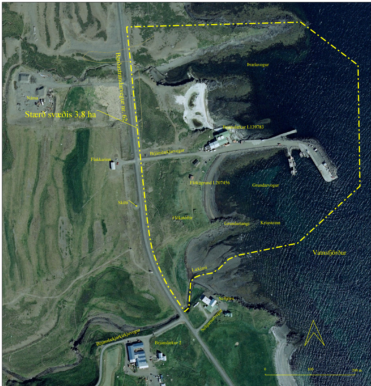
Skipulagssvæðið eru sýnd með gulri línu.