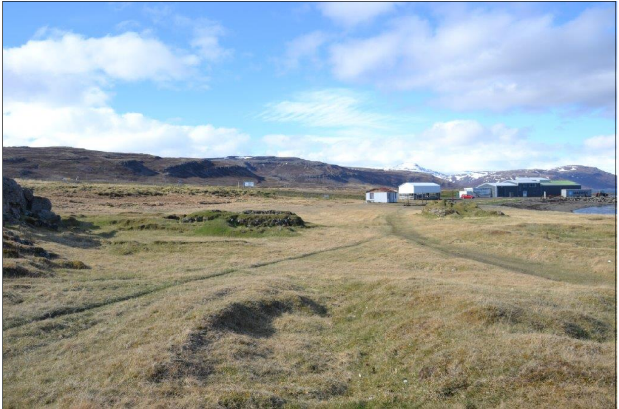
Flókatóftir séðar frá suðri.