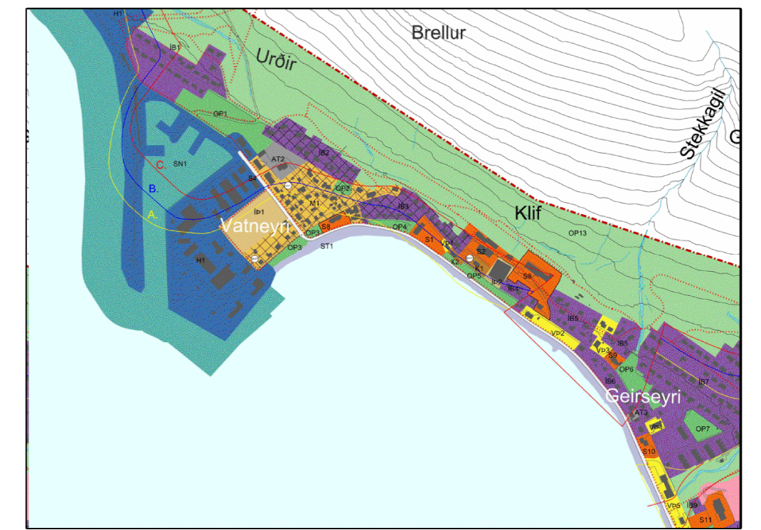
Aðalskipulag Vesturbýggðar 2018-2035