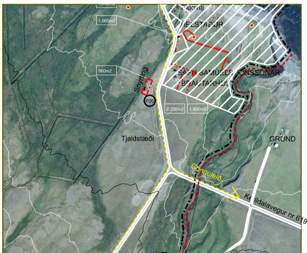
Tillaga að breytingu á deiliskipulagi í febrúar 2022