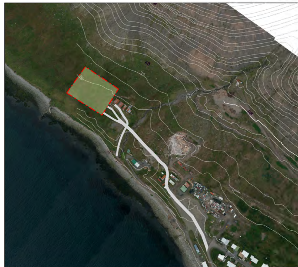
Yfirlitsuppráttur mkv 1:5000