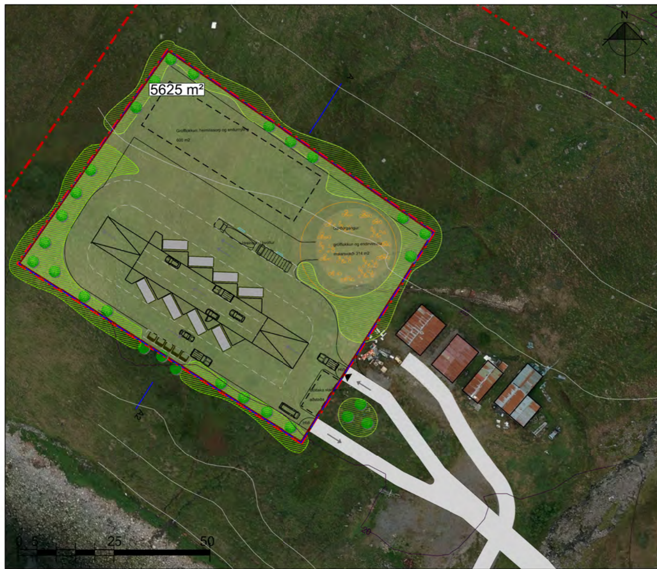
Deiliskipulagsuppráttur mkv 1:1000