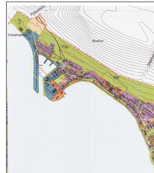
Aðalskipulag Vesturbyggðar 2006-2018

Annað í deiliskipulagi og greinargerð er óbreytt.