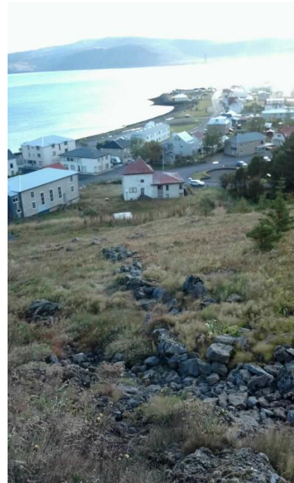
Mynd 3. Garðurinn liggur niður brekkuna, ofan við Skjaldborg.

Minjalýsing: Garðurinn er um 1 m að breidd og 40 m á lengd og er að mestu ógróinn.