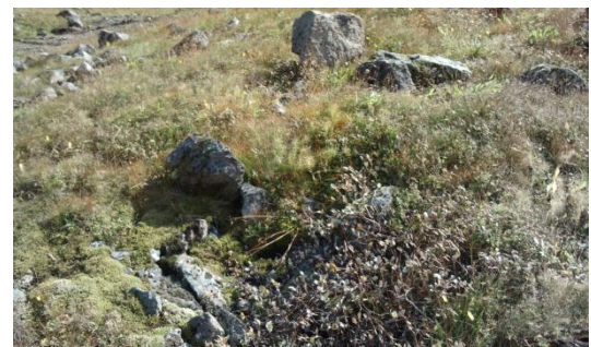
Mynd 5. Lítil hringlaga hleðsla.

Staðhættir: Við hliðina á hringlaga hleðslunni [1893-4] og ofan við garðlagið [1893-3] er mjög lítil hringlaga hleðsla.