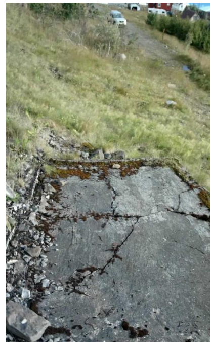
Mynd 2 Steypt plata af litlu húsi.

Minjalýsing: Steypan er greinilega gömul því að mól er í henni og var því skráð. Mögulegt er að þarna hafi staðið hús í tengslum við matjurtargarðinn. Platan er 2x3 m. Mjög ólíklegt er að grunnurinn flokkist sem fornleifar en er mögulega frá fyrrihluta 20 aldar.