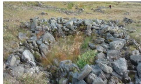
Mynd 4. Hringlaga hleðsla mögulega aðhald.

Minjalýsing: Nokkuð hefur verið lagt í þessa hleðslu og er hún hringlaga og veggir hennar um 1,5 m á breidd. Hleðslan er 6 m á breidd og 6.5 m á lengd. Ekki er ljóst hvaða tilgangi þessi hleðsla hefur þjónað. Þetta gæti mögulega verið aðhald fyrir dýr þar sem op er á hleðslunni sem snýr í átt að fjalli.