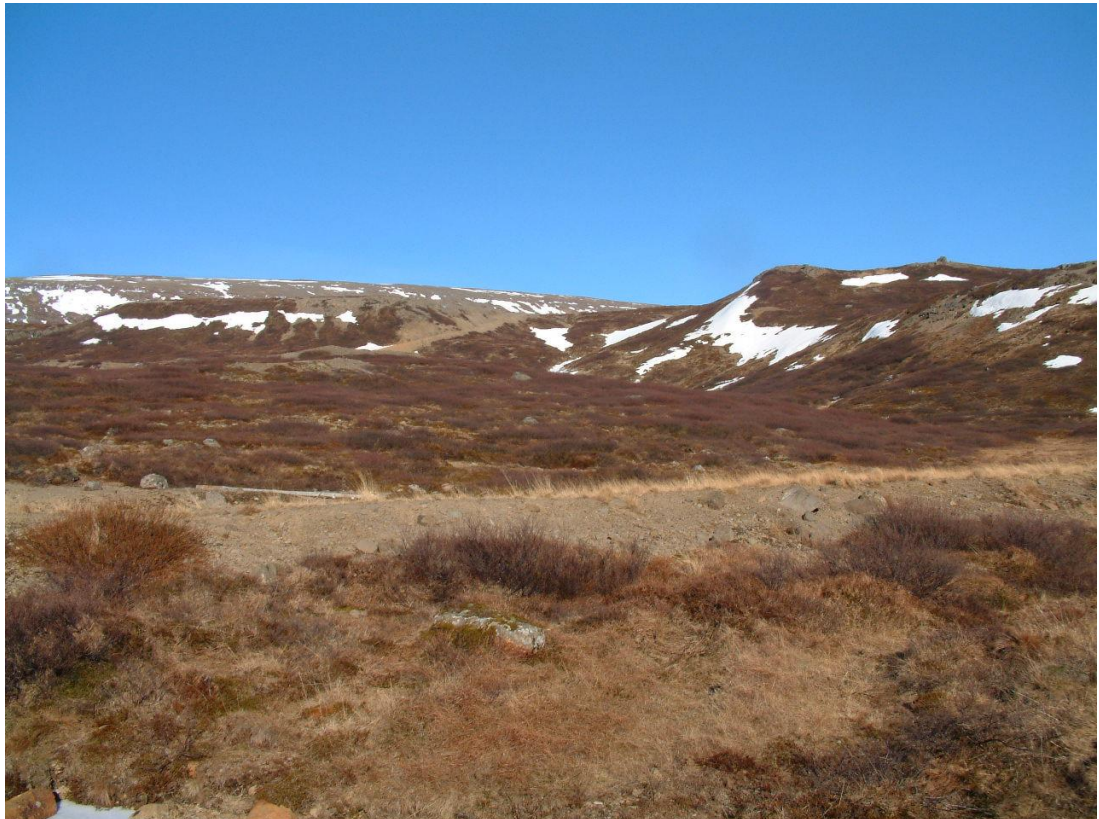
Mynd 3. Horft til norðurs upp með Ósá