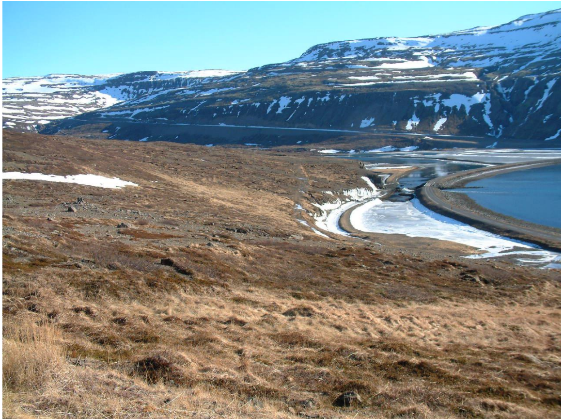
Mynd 2. Horft í yfir austurhluta svæðisins í átt að Kleifarheiði

Landið snýr á móti suðri og er meðal halli á lóðum frá 10-25%. Í grófum dráttum eru bröttustu löndin vestan til en inn á milli eru byggingarstæði í hvilftum og stöllum þar sem landhalli er minni. Vegna landhallans er gott útsýni til fjalla og yfir fjörðinn.