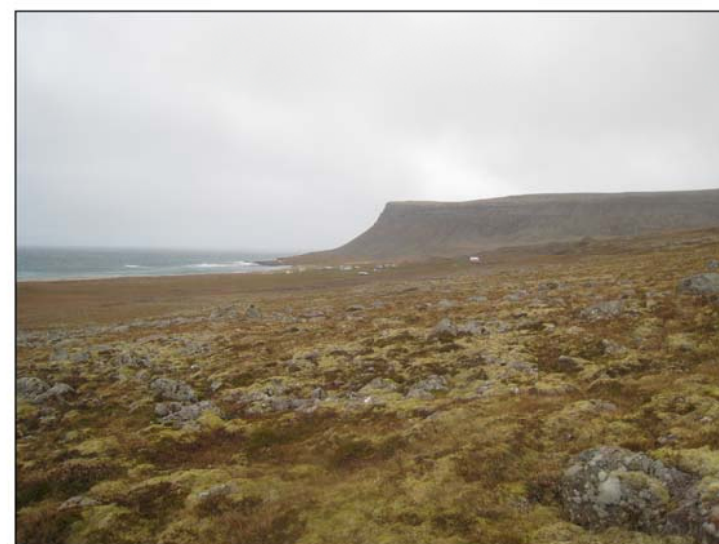
Hvallátur séð frá áningarstað