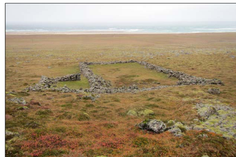
Rétt nálægt áningarstað við nýtt vegstæði

SKÝRINGARMYND: MINJAR VIÐ NÝTT VEGSTÆÐI - MKV. 1:2000