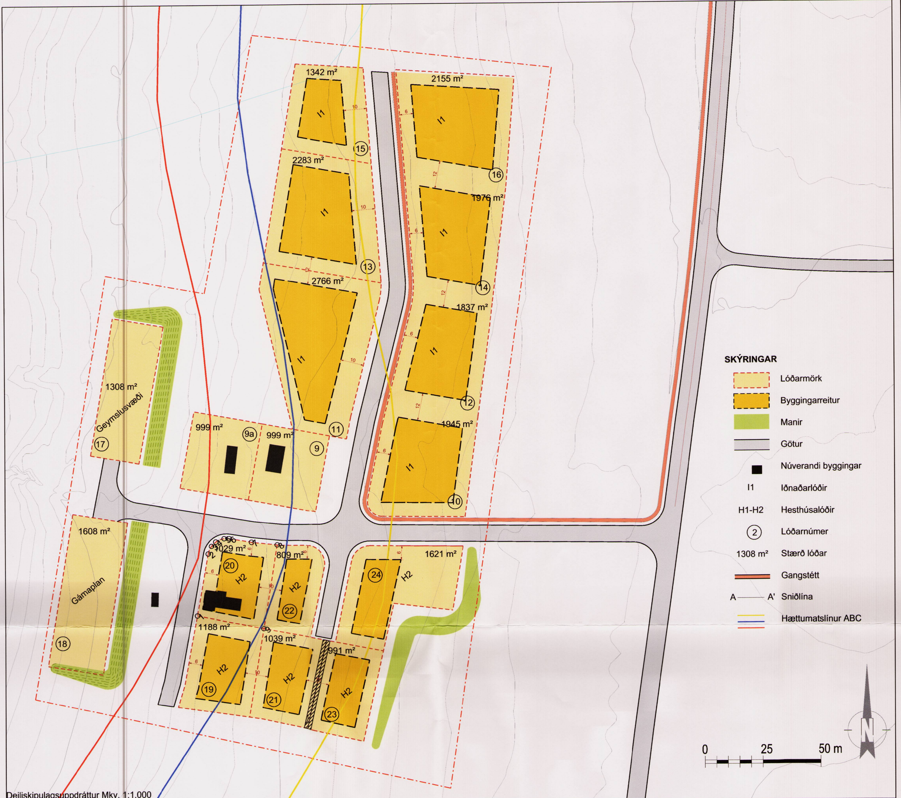
Deiliskipulagsuppráttur Mkv. 1:1.000