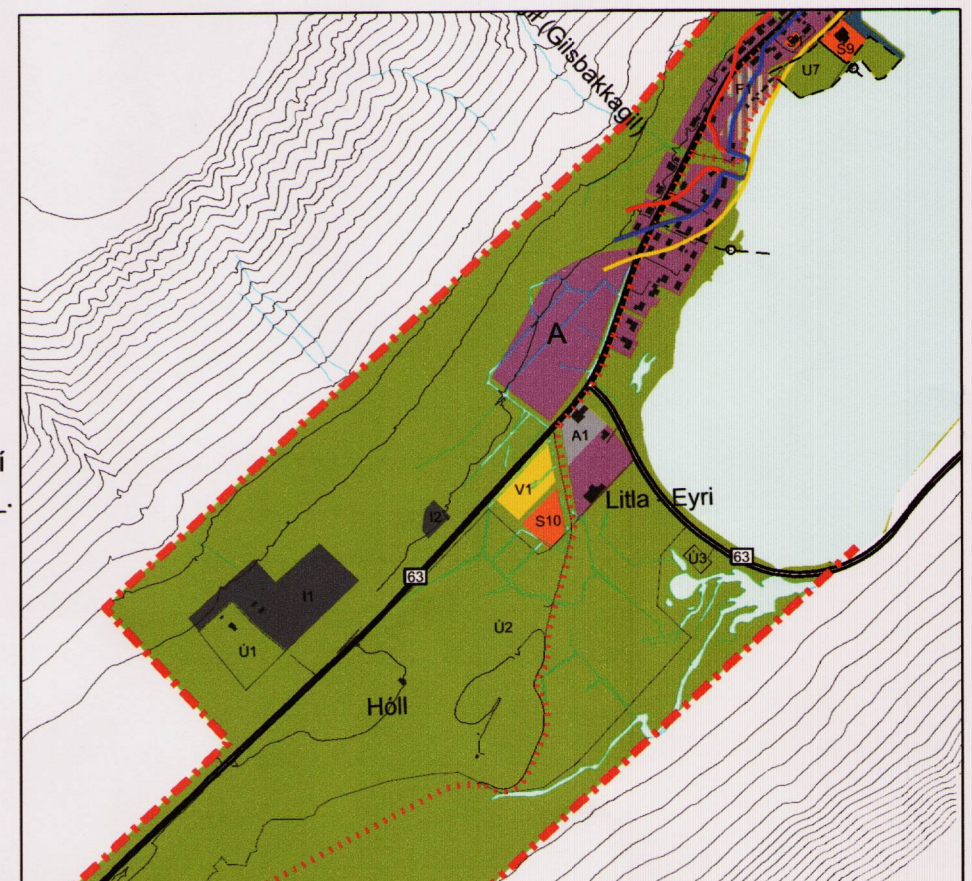
Hluti úr staðfestu aðalskipulagi

Uppdráttur og greinargerð lagfært m.t.t. athugasemda Skipulagsstofnunar dags. 24.6.2016 og fundar 22. ágúst 2016.