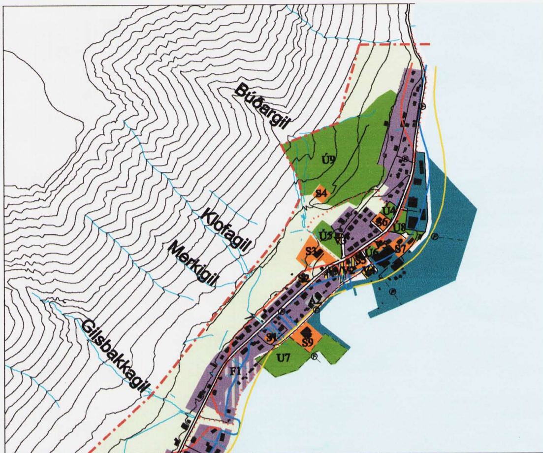
Gildandi aðalskipulag, staðfest 15.2.2006, mkv. 1 : 10 000