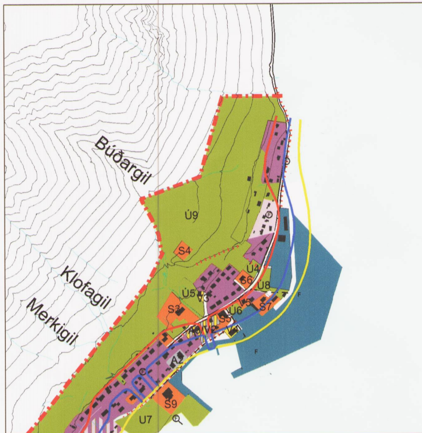
Gildandi aðalskipulag, þéttbýlisuppráttur af Bíldudal, staðfest 15.2.2006, mkv.1:10.000.

Aðalskipulagsbreyting, breytt mörk þéttbýlis á Bíldudal, nýtt iðnaðarsvæði á Bíldudal og athafnasvæði á Patreksfirði