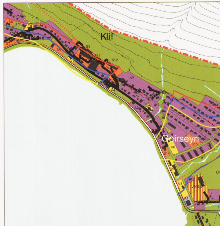
Gildandi aðalskipulag, þéttbýlisuppráttur af Patreksfirði, staðfest 15.2.2006, mkv.1:10.000.