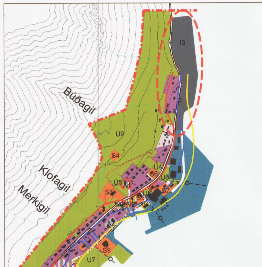
Breyting á aðalskipulagi, þéttbýlisuppráttur af Bíldudal, mkv. 1:10.000.

Meðfylgjandi skipulagsupprætti þessum er greinargerð dags. 19.03.2014. br. 15.05.2014