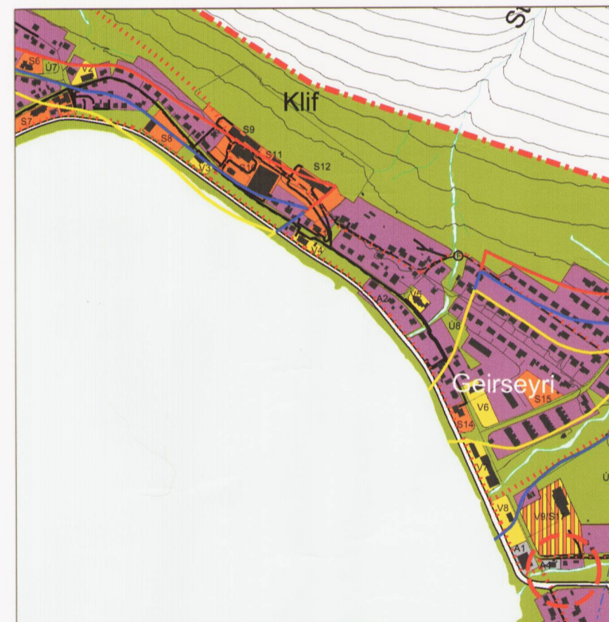
Breytingu á aðalskipulagi, þéttbýlisuppráttur af Patreksfirði, mkv. 1:10.000.

Aðalskipulagsbreyting þessi sem auglýst hefur verið skv. 31. gr. skipulagslaga nr. 123/2010 var samþykkt í bæjarstjórn þann